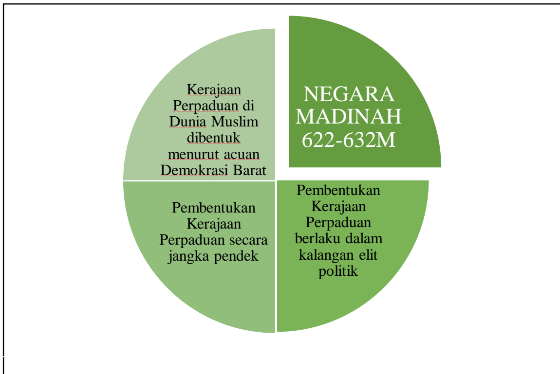
Rajah 1: Isu Utama Wacana Sarjana Terhadap Kerajaan Perpaduan di Dunia Muslim