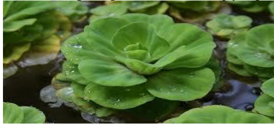
Rajah 2: Bunga Kiambang

yang dimanifestasikan dalam lagu dan syair oleh pengkarya muzikal. Hal ini kerana sifat kiambang yang teguh dan menggambarkan jiwa yang penuh pengharapan kepada ketenangan dan kedamaian. Dari sudut KONTEKS WARNANYA pula, kiambang adalah tumbuhan pakupakis yang daunnya disebut sebagai bunga atau flora berwarna hijau. Hijau adalah warna agama yang melambangkan peraturan kehidupan dan manusia mesti berlandaskan agama bagi membataskan manusia melakukan perkara-perkara yang mungkar. Kesemua konteks ini jelas menyerlahkan sifat kiambang yang mampu hidup mandiri dan tumbuh harmoni bersama hidupan lain di dalam air. Jadi konteks-konteks ini meninggalkan kesan konteks yang akhirnya memahamkan pendengar dengan mesej pantun. Sekiranya konteks ini dapat ditanggapi dengan baik oleh pendengar, maka pantun ini melivatkan kos memproses yang fendah, akan tetapi jika berlaku tafsiran makna yang berlapis-lapis oleh pendengar, maka kos proses menjadi tinggi. Dalam konteks pantun ini, makna kiambang disampaikan dengan begitu teradun dan berhati-hati oleh pengkarya. Konsep-konsep lain seperti leksikal perigi , bulan , awan dan pergi diadunkan bersekali dengan leksikal kiambang bagi menyerlahkan mesej yang dihajati. Oleh itu, kesemua konsep ini menjadi pengukuh awal kepada pemahaman mesej yang dihajatkan pemantun.