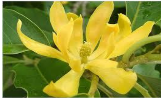
Rajah 1.2.1 Bunga Kenanga sebagai lambang cinta lelaki yang tegar

Bunga kenanga dimanipulasikan bagi menonjolkan sifat pencinta yang tegar dan teguh akan cintanya. Sifat ini diekspresikan melalui sifat realiti bahan alam, iaitu bunga kenanga tersebut. Tumbuhan ini merupakan tumbuhan liar yang tumbuh subur di daerah yang tinggi 1200 meter dari aras laut. Bunga kenanga biasanya ditanam sebagai peneduh halaman rumah dan ditepi-tepi jalan kerana sifatnya yang tahan dengan pelbagai keadaan cuaca. Sifat intrinsik bunga ini diimplementasikan sebagai sifat lelaki yang sangat teguh akan cintanya diterjemahkan melalui pantun tersebut berjaya dijana oleh penyair. Keunikan penyair dalam memanipulasikan bahan alam ini menunjukkan ketajaman daya taakul penyair dalam menyerlahkan acuan pemikiran Melayu.