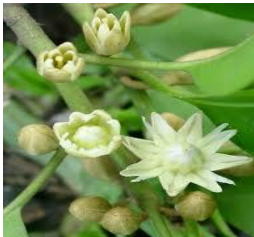
Rajah 1: Bunga Tanjung dilambangkan sebagai kelestarian adat pusaka.

istana, selaian digunakan dalam upacara-upacara penyeri dalam mandian dan majlis tertentu. Justeru, pengkajian yang lebih mendalam perlu lagi dilanjutkan bagi membuat interpretasi inkuisitif terhadap hubungan kaitan bunga-bunga ini dengan makna kelestarian adat pusaka. Maka sudah tentulah kajian yang berbentuk inkuisitif perlu dilaksanakan seperti kajian ini yang sememangnya amat berharga dalam usaha mendidik masyarakat menyelongkar upaya intelektual dan daya taakul pengkarya dalam penciptaan pantun.