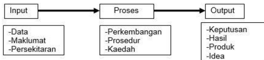
Rajah 2: Paradigma Input, Proses dan Output

ADDIE mengadaptasi input, proses dan output sebagai satu jalan untuk melengkapkan kesemua fasa (Dick & Carey, 1996). Input akan bertindak balas dengan pemboleh ubah yang dikenal melalui penerimaan data, maklumat dan pengetahuan (Branch, 2009). Proses pula dilihat jalan untuk merangsang pemikiran kreatif dalam menggunakan prosedur, menterjemah serta menerangkan pelbagai pendekatan yang boleh digunakan dalam proses pembelajaran (Branch, 2009). Output menghantar keputusan daripada fasa proses dalam tindakan yang sewajarnya (Morrison, 2010).