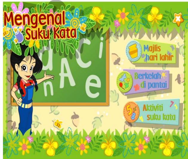
Rajah 2: Antara muka pengguna bagi Scene 1

Seterusnya dalam fasa Pembangunan, material atau bahan untuk perisian kursus dihasilkan berdasarkan keputusan yang telah dibuat semasa fasa Reka bentuk. Antara perisian yang diperlukan dalam pembangunan perisian kursus ini ialah Macromedia Authorware 7 , Adobe Photoshop CS2 dan Adobe Flash CS3 . Rajah 2 menunjukkan antara muka pengguna yang telah dihasilkan berdasarkan reka bentuk papan cerita bagi Scene 1.