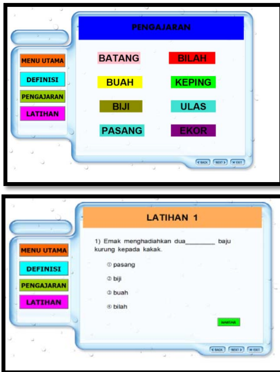
Rajah 1: Snapshot perisian tatabahasa penjodoh bilangan