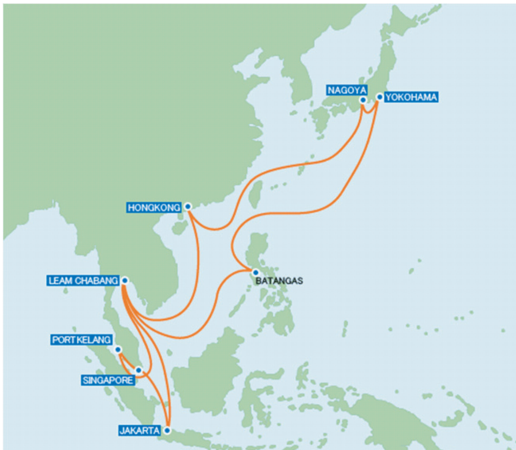
Peta 1.0: Lokasi Pelabuhan-pelabuhan Utama di Asia Tenggara

Namun, sejak abad ke 20 sebahagian besar daripada pelabuhan-pelabuhan utama di dunia mula bertumpu di rantau Asia iaitu di Asia Tenggara dan Asia Timur. Dalam tahun 2009, 15 daripada 20 buah pelabuhan kontena utama dunia terletak di Asia manakala hanya lima buah pelabuhan sahaja terletak di barat. 2 Antara 15 buah pelabuhan tersebut termasuklah Pelabuhan Singapura yang merupakan pelabuhan kontena utama dunia, Pelabuhan Hong Kong, Pelabuhan Shanghai, Pelabuhan Busan, Pelabuhan Kelang serta beberapa buah pelabuhan lain di China iaitu Guangzhou, Ningbo, Tianjin, dan Xiamen seperti yang dapat dilihat pada Peta 1.0. Merujuk kepada Peta 1.0 tersebut,